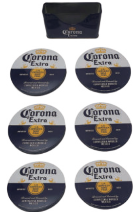
コースターサイズ：Φ100mm

CORONA コースターセット S/6 1680yen 5%up 9/ 未予定 JAN 0078678423506