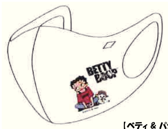
【ベティ & パジー】